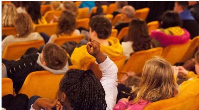
Schüler*innen im Kinosaal